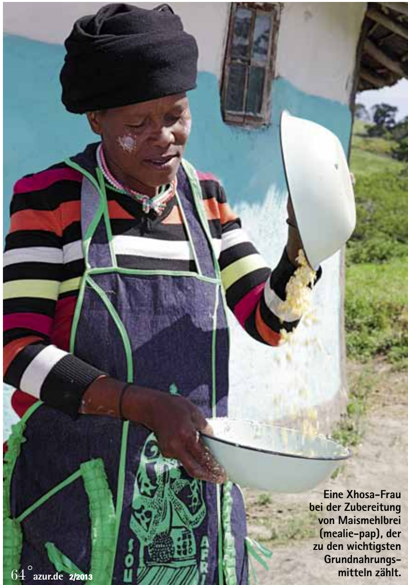
Eine Xhosa-Frau bei der Zubereitung von Maismehlbrei (mealie-pap), der zu den wichtigsten Grundnahrungsmitteln zählt.