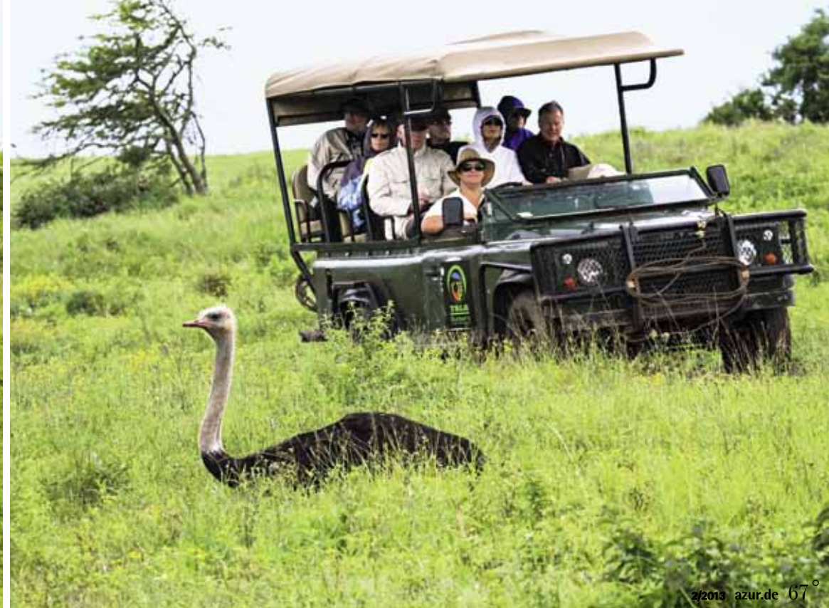
Safari-Feeling pur. Per Jeep ging es durch das unwegsame Gelände, um die besten Blicke auf die Tiere zu erhaschen.