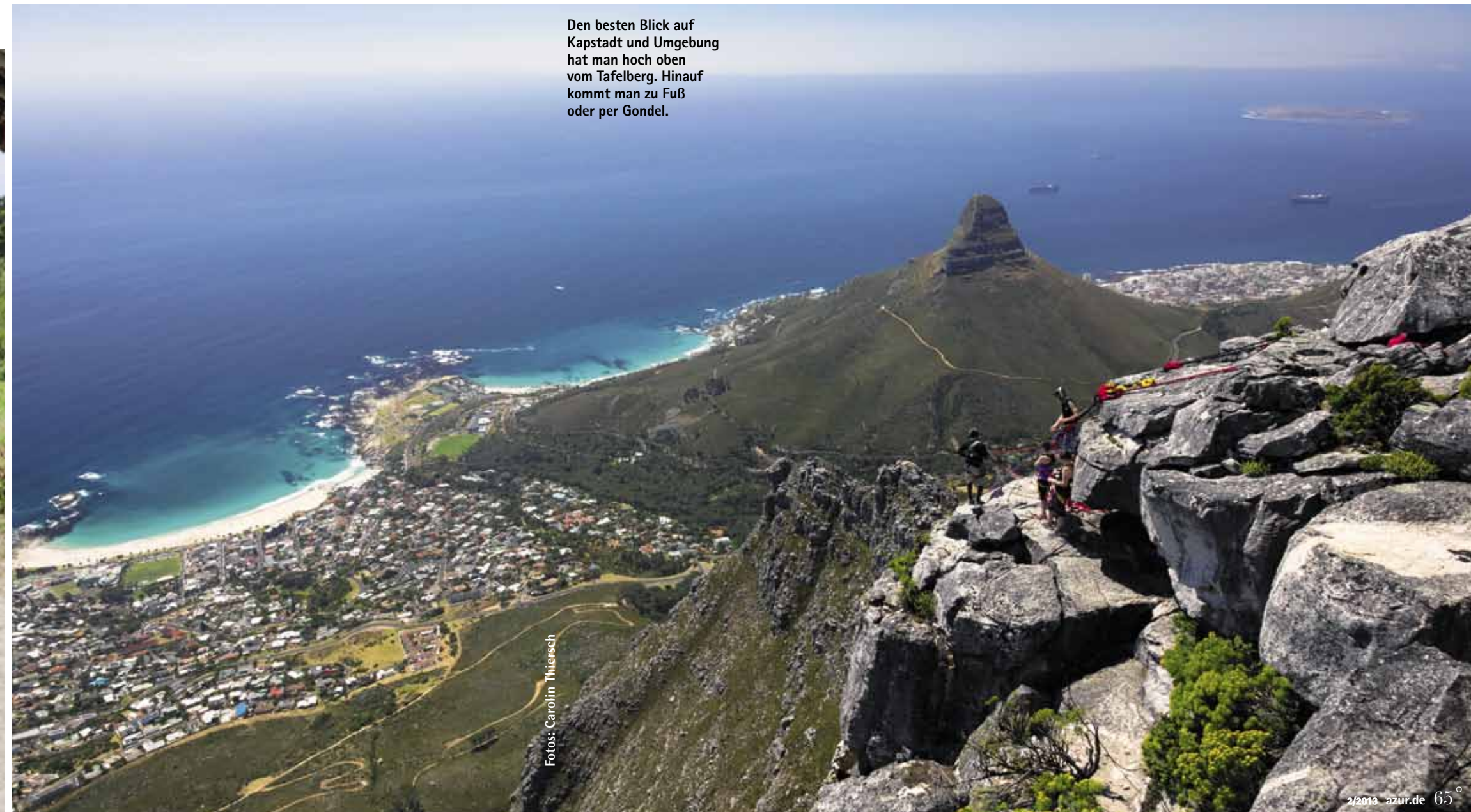
Den besten Blick auf Kapstadt und Umgebung hat man hoch oben vom Tafelberg. Hinauf kommt man zu Fuß oder per Gondel.