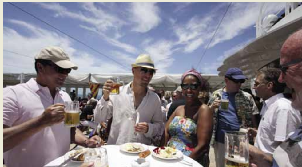
Bei Blasmusik und bayerischem Buffet wurde ausgelassen auf dem Sonnendeck gefeiert.