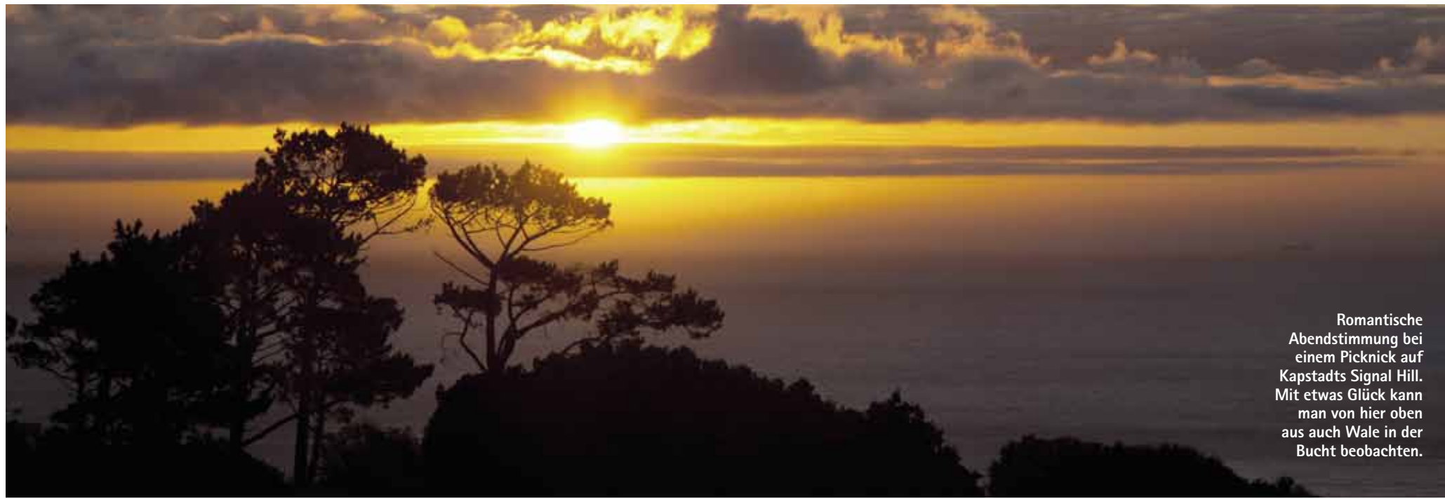
Romantische Abendstimmung bei einem Picknick auf Kapstadts Signal Hill. Mit etwas Glück kann man von hier oben aus auch Wale in der Bucht beobachten.